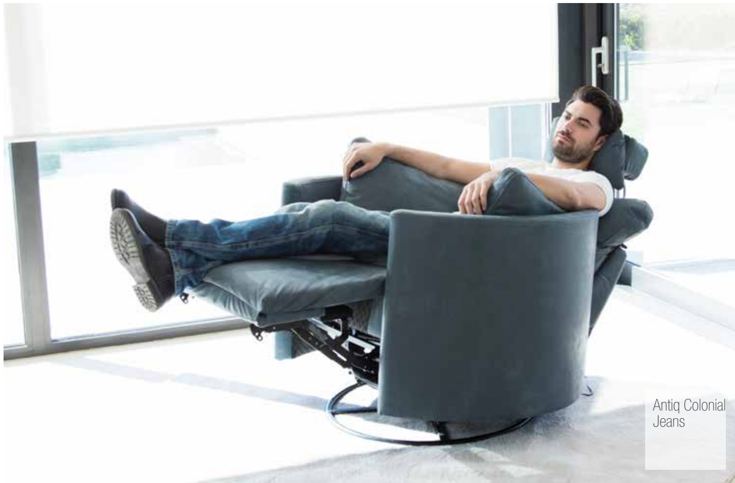
Antiq Colonial Jeans